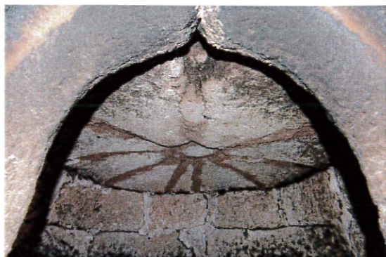
Four du Fromental : Restauration de la voute et de la toiture