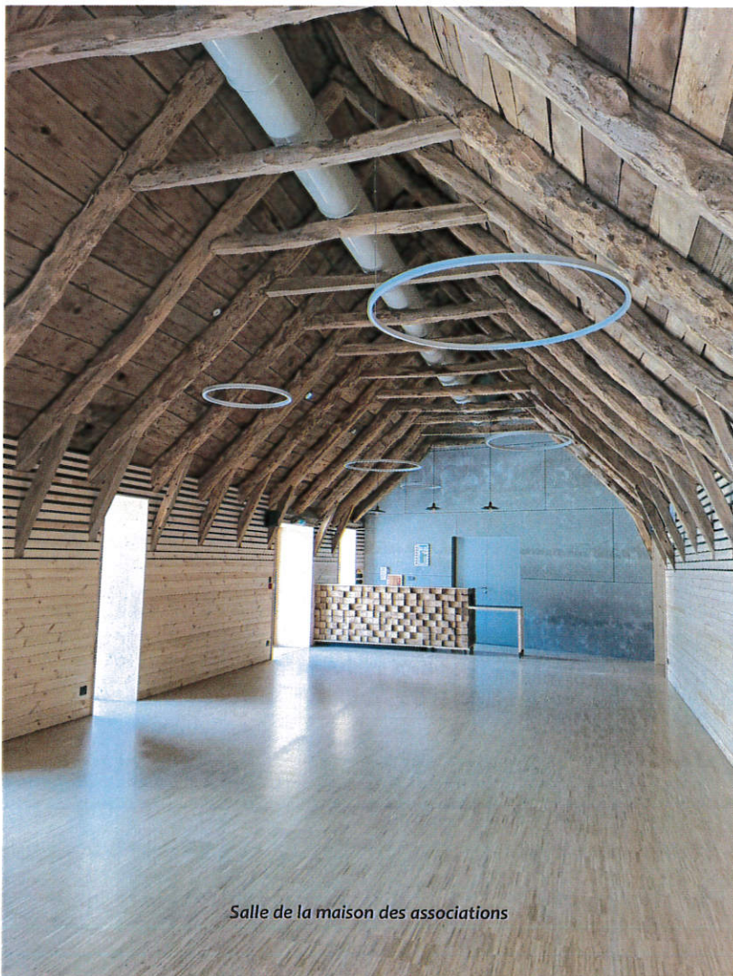
Salle de la maison des associations

Notre commune a vu de nombreux projets se concrétiser en 2024. Les travaux de la maison des associations sont terminés et nous avons eu le plaisir de vous la présenter le 18 août lors d'un moment convivial.